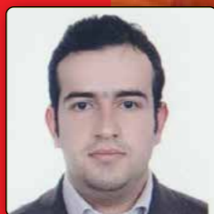
ضرورت اصلاح نگاه دولت به تولید و تجارت علی رهبری کارشناس اقتصادی