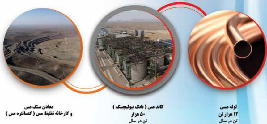
معدن سنگ مس و کارخانه تغلیظ مس (کنسانتره مس)